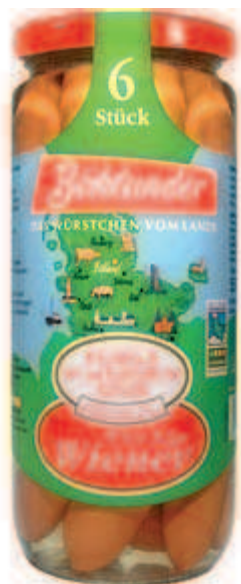
Im Glas stecken sechs Würstchen vom Lande, denen die Stiftung Warentest ein gutes Qualitätszeugnis ausstellte.

BERLIN – Zu den Lieblings Speisen der Deutschen – ob kalt oder heiß – zählen zweifelsohne Wiener Würstchen . Aber nicht alle sind auch ein Genuss. Die Stiftung Warentest verteilt in der August-Ausgabe ihrer Zeitschrift „test“ bei acht der 20 getesteten Marken ein „gut“, zwei Marken waren „mangelhaft“. Die beiden Testsieger „Böklunder“ aus Böklund in Schleswig-Holstein und „Halberstädter“ aus Halberstadt in Sachsen-Anhalt kamen aus dem Glas. Auch zwei Produkte aus dem Kühlregal wurden mit „gut“ bewertet. Viermal waren die Wiener nur „ausreichend“. Bei den mit „mangelhaft“ benoteten Wienern sei ein unangenehmer Geruch nach Scheuermittel aus der Verpackung geströmt, die Würstchen seien von einem schmierigen Film überzogen gewesen und hätten säuerlich geschmeckt, erklärten die Tester. Alle getesteten Würstchen erhielten mehr hochwertiges Muskelfleisch als die vorgeschriebenen 75 Prozent.