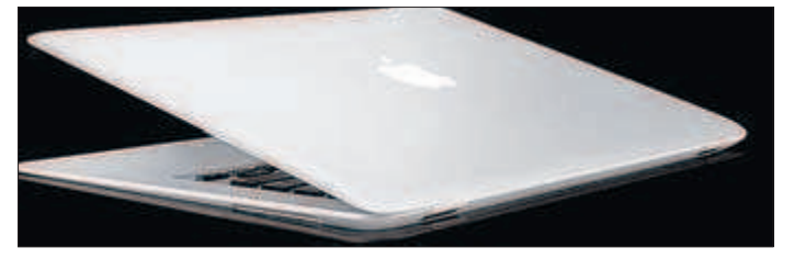
Das MacBook Air von Apple (1699 Euro) war der Renner unter den vermeintlichen Schnäppchen.

WIESBADEN – Die Preise für Notebooks und Desktop-Computer haben sich allein in den vergangenen vier Jahren mehr als halbiert. Die Ladenpreise für Notebooks gingen von 2005 bis Juni 2009 um knapp 61 Prozent zurück, die für Desktop-PCs um rund 58 Prozent, so das Statistische Bundesamt. Die durchschnittliche Speicherkapazität der Notebook-Festplatten vervierfachte sich auf 250 Gigabyte.